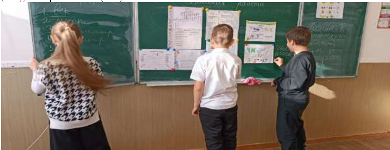
Учащиеся 4-Б класса