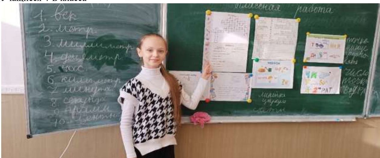
Учащиеся 4-Б класса